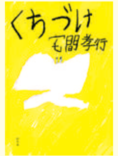
「くちづけ」 宅間 孝行 著

今回ご紹介するのは、同名の舞台作品(演劇)を小説化したもの。書籍を原作とした映画やドラマが多く制作されていたり、逆に映像作品のノベライズ本が発売されたりすることはよくありますよね。また、最近では、人気の高い書籍や映像作品の舞台化も増えてきましたが、舞台作品の書籍化というのは珍しいので、なかなか目にする機会も少ないのではないのでしょうか。