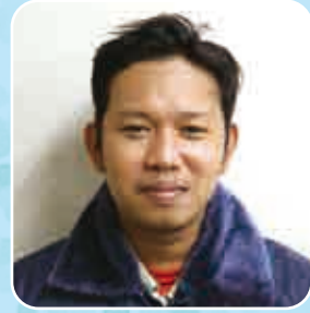
イマムさん (本社工場) IWWIから鈴秀研修