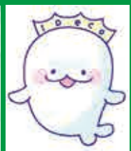
iDeCo 普及推進キャラクター イデコちゃん