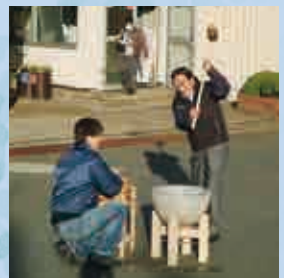
社長による餅つき