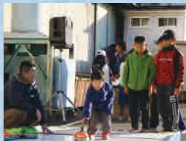
カーリングで遊ぶ子どもたち