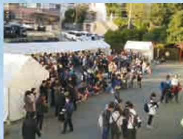
全体で総勢162名参加