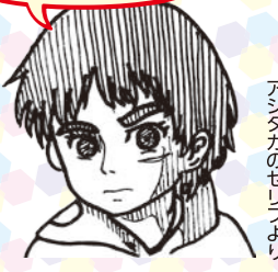
映画「もののけ姫」 アシタカの子供のセリフより