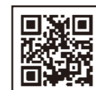
ミツカンミュージアム