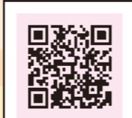
NPO法人 となりのかいご

在宅介護を選択したら、ケアマネージャー(介護支援専門員)さんを決定します。たくさんの方の経験と知識をもった頼れるパートナーです。要介護者(介護される側)の状況は様々。そして介護には先が見えません。不安や悩み、ストレスを繰り返すなか、ケアマネ(ケアマネージャー)さんとの信頼関係はとても重要。本音で関係性をつくれる同志としてお付き合いできれば最高です。ケアマネさんは、優しく受け止めてくれる頼れる存在なのです。