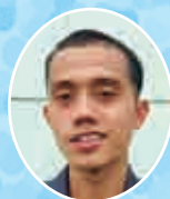
ワフユ ジョコ スティアワン