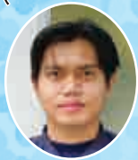
デデ アエップ ラエディ