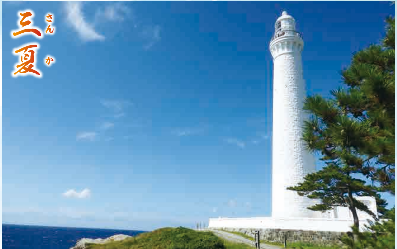
『出雲日御碕灯台』撮影…譜久島