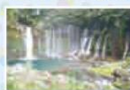
新富士IC(新東名)から 車で40分

ドライブ当日、さわやかに晴れていたなら、ぜひとも【白糸の滝】へ。富士の湧き水が20mの高さからまるで糸を垂らすように、湾曲した150mの絶壁を流れ落ちていきます。そのしぶきが織りなす虹の美しさは必見です。散策でおなかのすいてきたら、「富士宮焼きそば」で空腹を満たしてください。B-1グランプリで連続優勝し、殿堂入りを果たしている絶対王者の焼きそばです。弾力があってくどなく、魚粉のトッピングで箸が止まりません。最後は「富士山サイダー」をグビッとやっ、次の目的地 沼津へとナビを設定! よくも悪くも沼津は地方都市。少し足をのばせば豊富な湯量に恵まれた長岡温泉や修善寺温泉が迎えてくれます。昨今開発が進む漁港で食すお寿司や魚料理は安くともうまい。この町に来て「魚」を食わないヤツは生きてる価値などありません。深海魚のミュージアムもあって時間はいくらあっても足りないくらい。