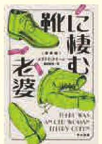
「靴に棲む老婆(新訳版)」 エラリー・クイーン 著

今回は海外ミステリー界の巨匠、エラリー・クイーン の作品です。クイーン と言えば、「Xの悲劇」を始め有名作品が多くありますが、中でもマイベストを紹介しますが、その本の舞台はニューヨーク。製靴業で成功したポツツ家を中心とした作品です。ポツツ家の女主人には子供が6人いて、先夫との子供3人は変人ぞろい、現夫との子供3人はまともで優秀、という設定。ある日長兄が異兄弟に対し、時代錯誤の決闘を申し込むところから物語は動き出します。 あらすじの時点で、ファンタジーっぽさを感じますが、この奇妙な一家にマザーグースの見立てという要素が加わり、盛り盛りに盛った設定になっているのが本作の特徴です。章ごとのタイトルからして、童話や童謡をベースとした作品を好む人にはたまらないはず。 こんな変わった設定でも、内容はちゃんとした本格ミステリー。ただ、仕掛け自体はシンプルなので、先の展開が全く読めないという感じではなく、むしろ設定を意識しすぎて身構えていると拍子抜けしてしまうかもしれません。それでも、ムダに感じる箇所がほとんどないため、途中で飽きてしまうことはないでしょう。中盤以降の二転三転する展開にはわくわくするし、他作品にはないような散りばめられた捻れと、終盤で披露される精巧に組まれたロジックは最高。とにかく圧倒され、惹き込まれるのです。もう、さすがクイーン としか言いようがない。 他のクイーン 作品と比べて、探偵役である「エラリー」が少しポンコツ気味なのが本作ならではの面白いところ。愛嬌すら感じます。著者と同