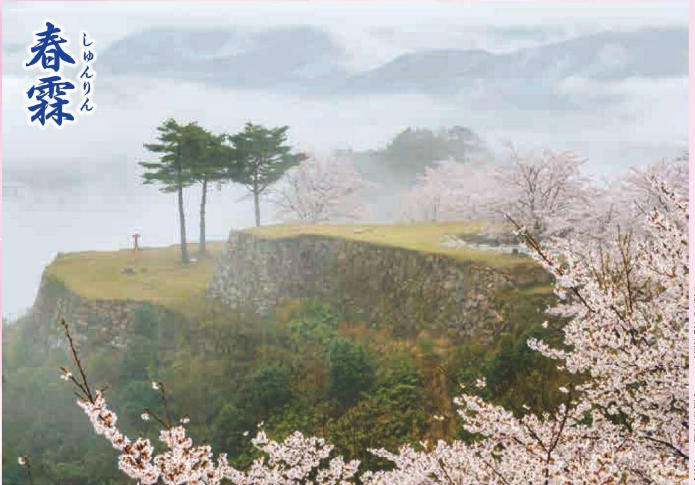
『天空の城』